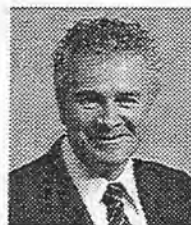
Commissioner for Oaths