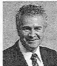
Commissioner for Oaths