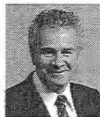
Commissioner for Oaths